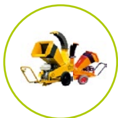
ŠTIEPKOVAČE A DRVIČE