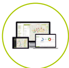
EVIDENČNÉ SYSTÉMY / ELVIS /