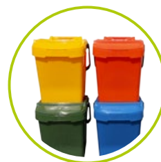
NÁDOBY NA TRIEDENIE ODPADU